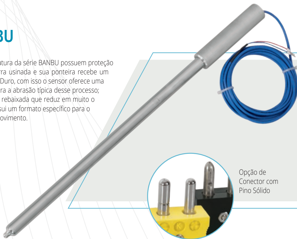
Opção de Conector com Pino Sólido

Os sensores de temperatura da série BANBU possuem proteção metálica a partir de barra usinada e sua ponteira recebe um revestimento de Cromo Duro, com isso o sensor oferece uma excelente proteção contra a abrasão típica desse processo; outro detalhe é a ponta rebaixada que reduz em muito o tempo de resposta, possui um formato específico para o corte da borracha em movimento.